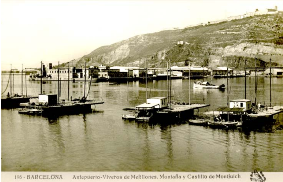
FOTOGRAFIA 31. Vivers de musclos a Barcelona. Al fons, podem veure el castell de Montjuïc.