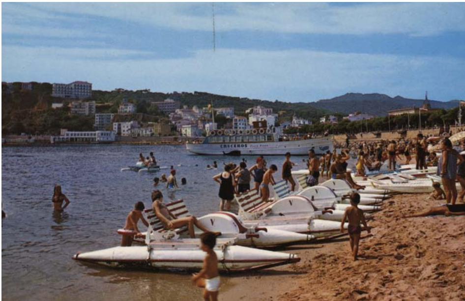
FOTOGRAFIA 35. Patins de pedals a la platja de Sant Feliu de Guíxols.

034 Hidrocicle de dos bucs. L'hidrocicle de dos bucs és un petit catamarà d'esbargiment que hom, assegut en un seient alt com el d'una bicicleta, mou pedalejant, car hi ha un mecanisme que s'encarrega que l'esforç dels peus faci girar una hèlice. A l'estany del parc de la Ciutadella de Barcelona hi hagué hidrocicles d'aquests durant una època no ben determinada al voltant dels anys vint del segle xx, com demostra la postal titulada Parque de Barcelona. Vista del estanque y casino (núm. 35 de la col·lecció) (fot. 36). Sembla que, a l'estany del Turó Park de Barcelona, també hi hagué hidrocicles durant la mateixa època, però això caldria confirmar-ho.