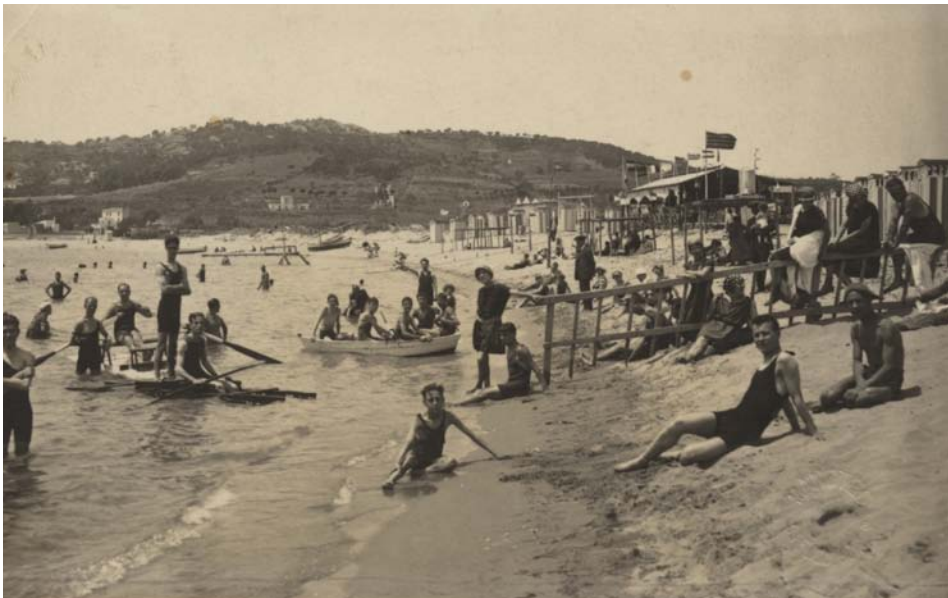
FOTOGRAFIA 33. A l'esquerra de la imatge, podem veure un patí amb dos remers parells, que era molt corrent a la costa catalana.