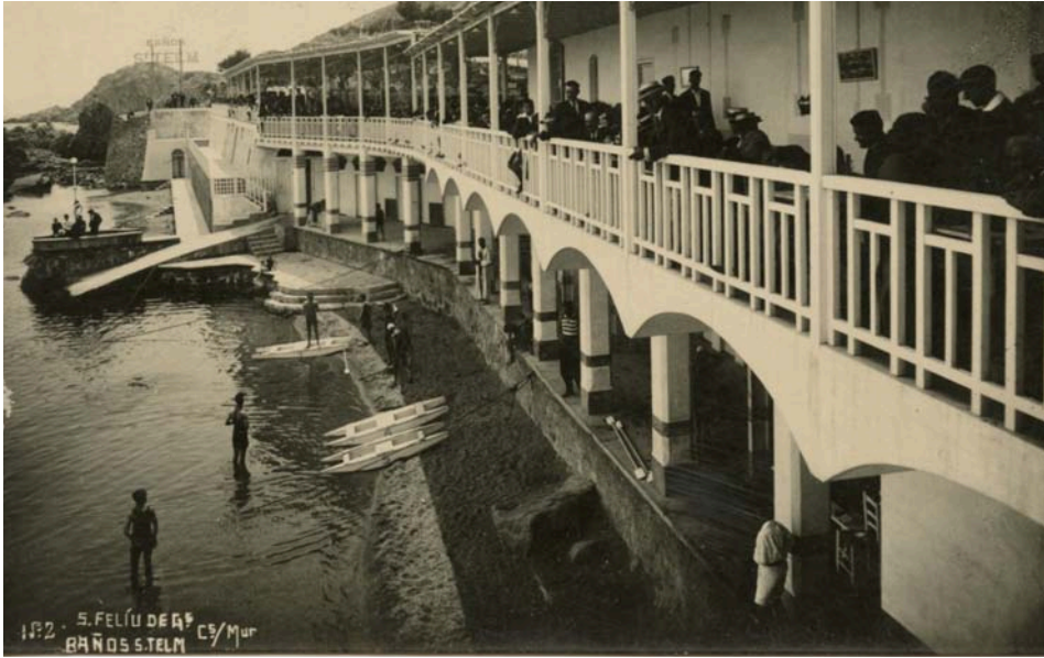
FOTOGRAFIA 32. Patins de rem de dues pales davant els Baños Sant Telm, a Sant Feliu de Guíxols.