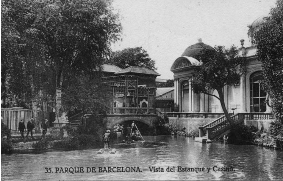
FOTOGRAFIA 36. Hidrocicle de dos bucs al parc de la Ciutadella (Barcelona).