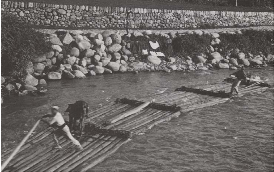
FOTOGRAFIA 38. Rai fluvial de quatre trams baixant per la Noguera Pallaresa davant la Pobla de Segur a començament del segle xx.

moltes formes de rais fabricats a corre-cuita; a tall d'exemple, en serà esmentada, només, una modalitat: el rai d'antenes (b. m. 043).