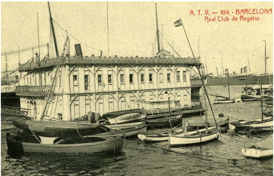
FOTOGRAFIA 30. Casa surant del Reial Club de Regates al port de Barcelona.