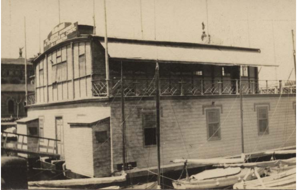
FOTOGRAFIA 29. Casa surant del Club de Mar del CADCI al port de Barcelona.