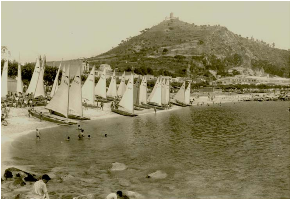
FOTOGRAFIA 34. Patins de vela a la platja de Blanes en un dia de regates. Al fons, el castell de Sant Joan.

032 Patí de vela. El patí de vela és un petit bastiment semblant al patí de rem de dues pales, però duu un arbre a proa on hissa una vela de tall. La particularitat més notable d'aquest catamarà és que no porta timó ni tampoc cap orsa, com podem veure en la postal publicada per Foto Romaní — Blanes (Costa Brava). Día de regatas = Jour de régates = Regata day (núm. 29 de la col·lecció)— (fot. 34). El patí de vela va nàixer a la platja del pla de Barcelona. En realitat, hom pot distingir dues formes bàsiques de patí de vela prou distintes: la de la primera època (primera meitat de segle xx, aproximadament), caracteritzada pel fet de tenir els bucs poc fins i configurats a base de cares planes, i la de la segona època (segona meitat de segle xx, aproximadament), caracteritzada pel fet de tenir els bucs molt fins i amb molt més puntal a popa que a proa. El patí de vela és corrent a tota la costa catalana.